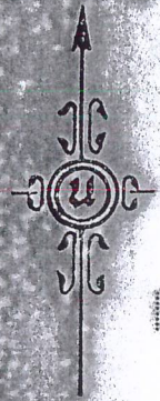
รูปแผนที่